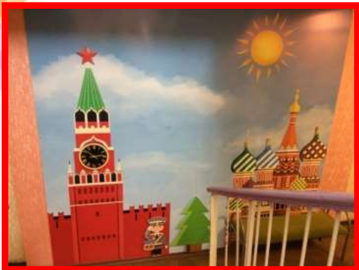
тематическая панель «Кремль»