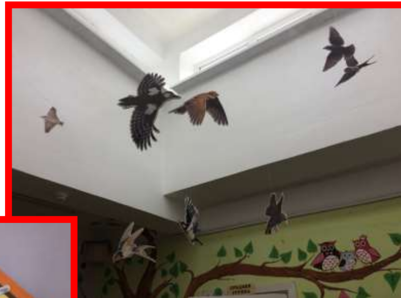
макеты «Птицы Крыма»