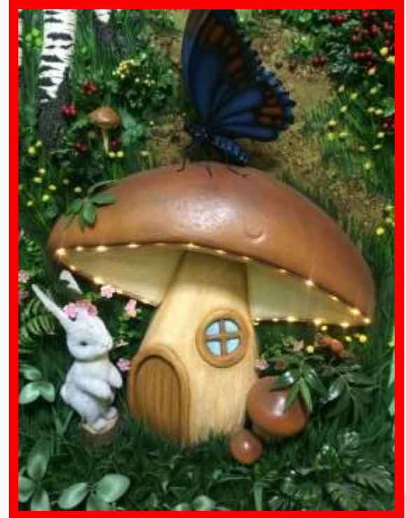
обучающая инсталляция «Под грибом»