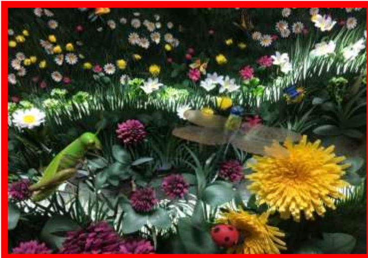
обучающая инсталляция «Насекомые и цветы Крыма»