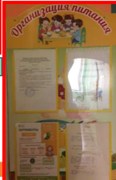
Стенд «Организация питания»