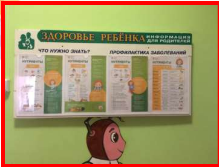
Стенд «Здоровье ребенка»