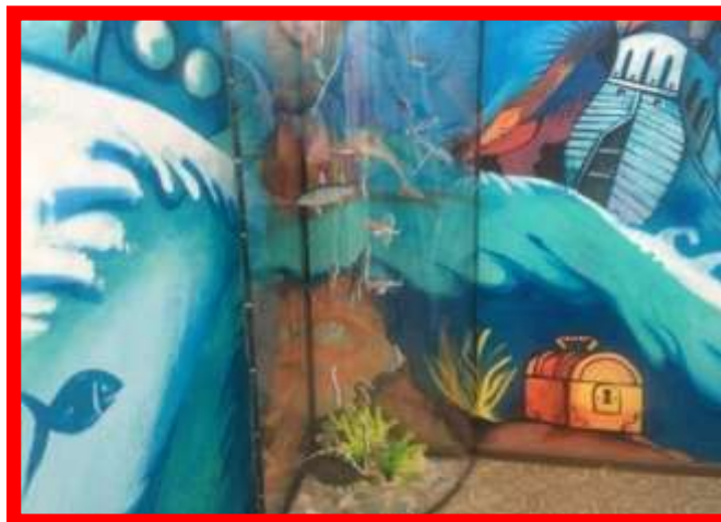
обучающая инсталляция-аквариум «Морские обитатели Крымских морей»