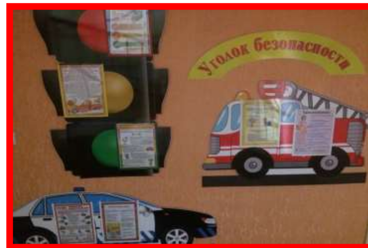
стенды Уголок безопасности