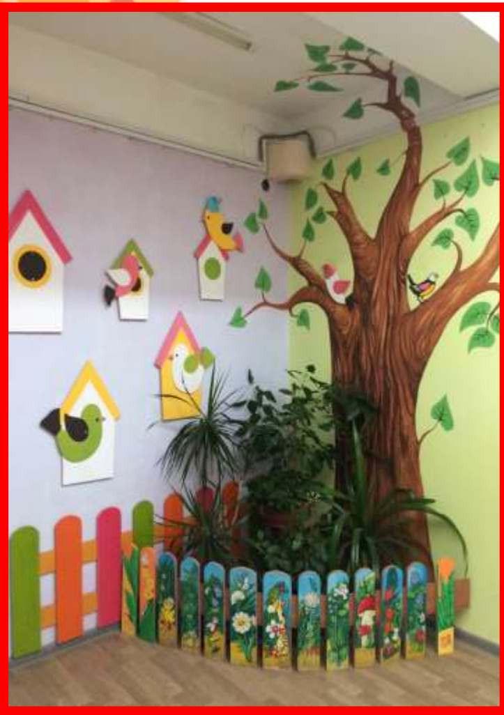
уголок природы (комнатные растения)