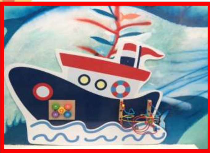
бизиборды «Корабль», «Черепашка»