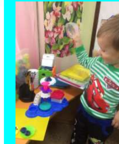
Творчество с пластилином Плей-До