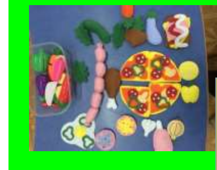
С/р игра «Кафе»(Создай свое блюдо)

Прослеживается взаимосвязь с другими видами деятельности. Интегрированный подход отражен в создании игровой среды.