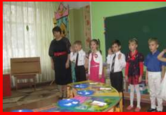
Открытый просмотр «В творческой мастерской»