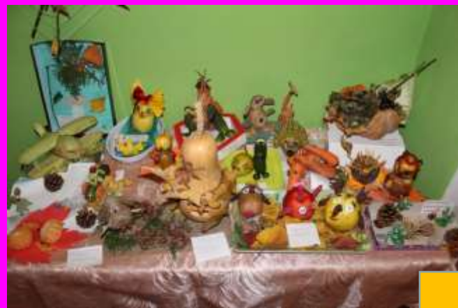
Выставки совместного творчества