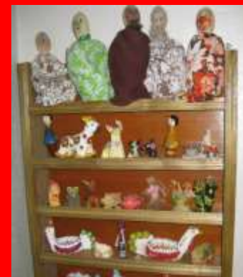
Музей ремесел «Светлица»

Развивающая эстетическая среда включает содержательные компоненты, которые активизируют эстетическое восприятие.