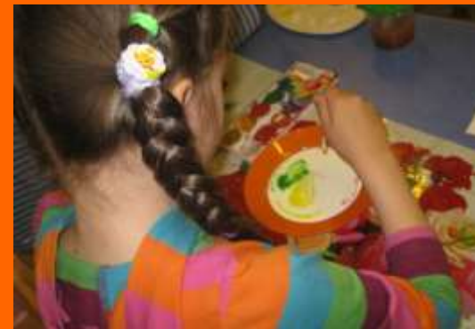
Рисование на молоке

Во взаимодействии специалистов прослеживается преимущество в осуществлении задач, в содержании педагогического процесса, что обеспечивает ребенку условия для максимальной творческой деятельности.