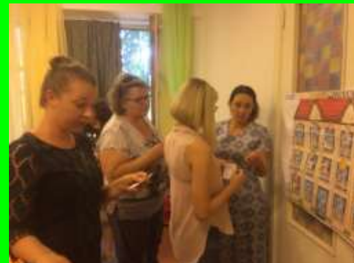
Школа молодого воспитателя