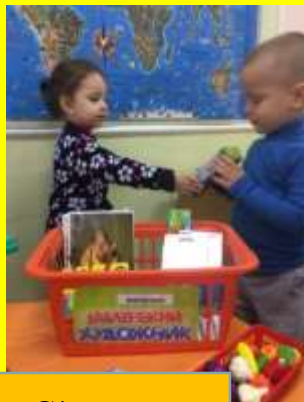
С/р игра «Магазин «Маленький художник»