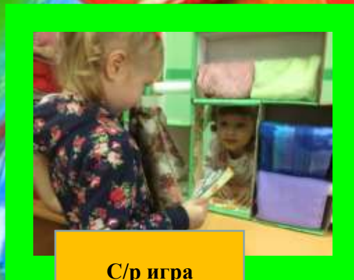
С/р игра «Магазин тканей»