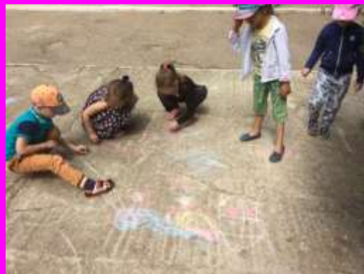
День защиты детей. Конкурс рисунков на асфальте