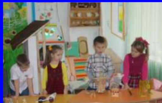
Знакомство с работами мастеров