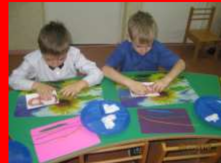
Интегрированные занятия по изодеятельности