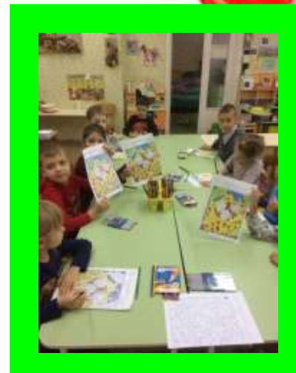
Изобразительные ребусы на занятиях познавательного цикла