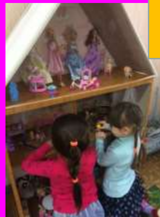
С/р игра «Дизайнеры- Уютный дом»