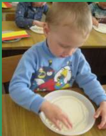
Рисование на крупе