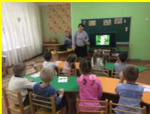
Использование ИКТ-технологий на занятиях по изодеятельности