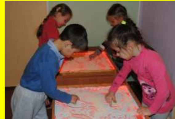
Рисование на световых столах