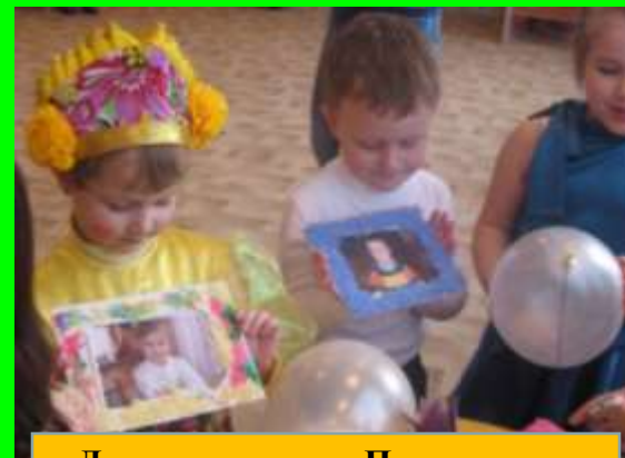
День творчества. Презентация своих работ