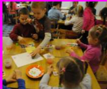
НОД с использованием нетрадиционных техник рисования