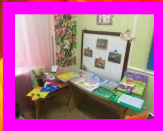
2 младшие группы