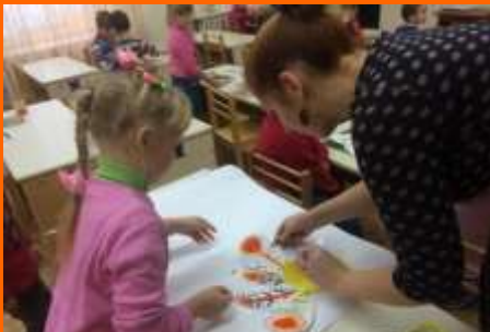
НОД по созданию коллективных работ