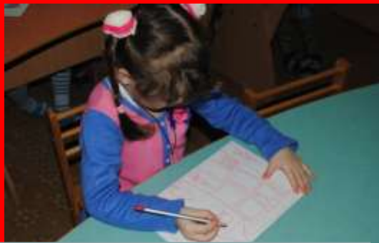
Рисование по замыслу