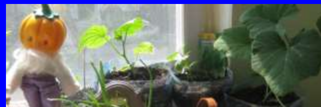
Мини-огороды на окне

Природная среда, обладающая эстетическими свойствами и качествами, позволяет развивать у детей эстетическое восприятие, представления; формировать эстетическое отношение к окружающему