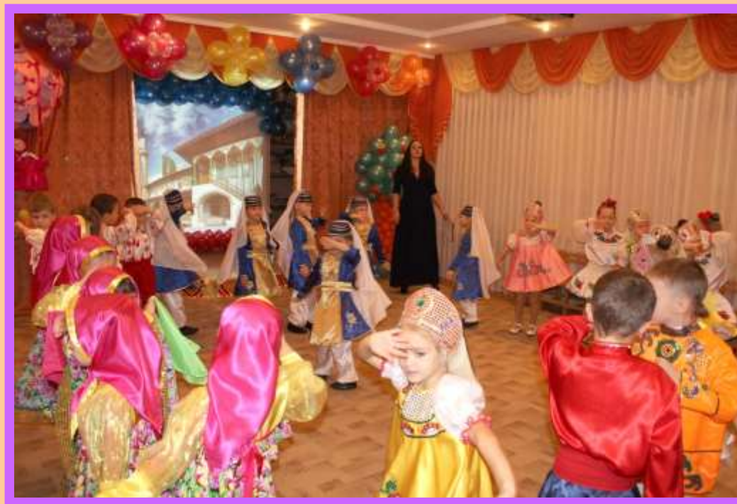
Татарская народная игра «Повторяй за мной»

Есть среди нас болгары и татары, В кругу танцуют и по парам Армяне, украинцы, немцы, греки Как в море русское впадают реки И каждый что-то новое приносит Сейчас мы сами их об этом спросим.