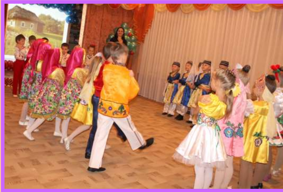
Украинская игра «Плетень»

В гру веселую «Плетень» Можем гратися весь день Хлопці та дівчата, дівчата та хлоп ята Станьте разом у рядок плетень заплетати!